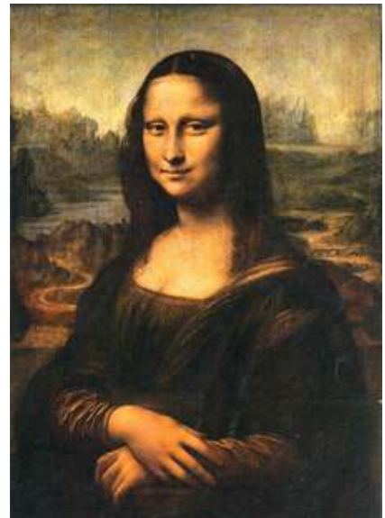
La Monalisa – Leonardo Da Vinci

El Renacimiento es el movimiento cultural y artístico iniciado en Italia en el siglo XV que dirige sus ojos al clasicismo romano y al hombre como centro de las cosas. La conquista de la tercera dimensión es fortalecida al colocar las figuras sobre un paisaje o en un interior, así tanto el propio volumen de la figura establece la profundidad, como también el hecho de moverse en un espacio aéreo a su alrededor. La mayor parte de la producción artística siguió consagrada a lo religioso, con tres propósitos: acrecentar la garantía de la predicación, lograr la emoción del fiel y conservar el dogma por medio de las imágenes. Otra característica del Renacimiento en Italia es el surgimiento del individualismo, el hombre se reconoce como individuo espiritual y como indicio de la creciente conciencia de sí mismos que cobran los hombres del siglo XVI, adquiriendo importancia la pintura de retratos donde príncipes, nobles y miembros del alto clero se hacen retratar y también miembros de la burguesía como los comerciantes, los banqueros, artesanos y eruditos humanistas e inclusive los artistas que lograron ganarse el reconocimiento de la sociedad y gozar de sus privilegios.