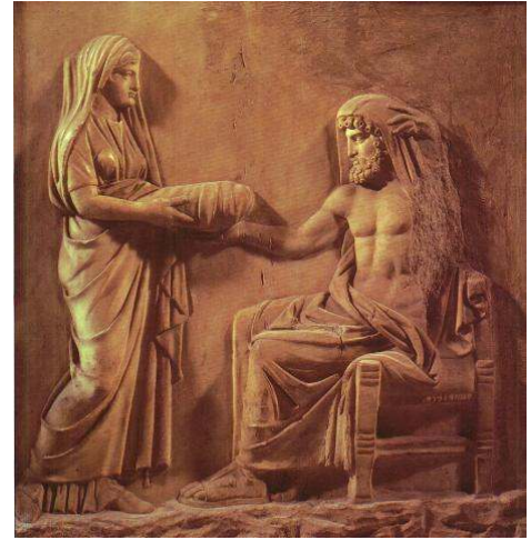
Rea y Crono - Bajorrelieve griego de época helenística.

El arte de la Antigua Grecia es el estilo elaborado por los antiguos artistas griegos, caracterizado por la búsqueda de la «belleza ideal», la belleza para los griegos estaba en la perfección, la proporción y la armonía. Estas ideas se plasmaron en la arquitectura y la escultura con la aplicación de los conceptos de 'orden arquitectónico' y 'canon de belleza', en ambos la belleza se concibe como proporción armónica entre las partes y el todo, sea de un edificio o del cuerpo. Comprende varios periodos como: el período arcaico, clásico y helenístico; cada uno con características particulares y una manera diferente de abordar su concepción de belleza y como representan su cosmovisión.